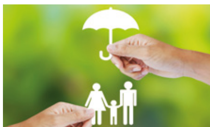
Das Lebensversicherungsreformgesetz (LVRG)