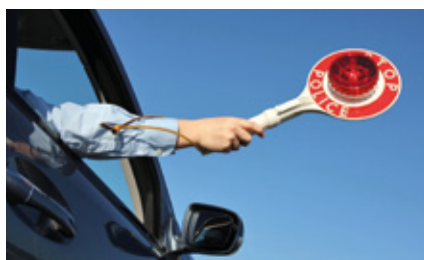
Versicherungsschutz in der Kfz-Versicherung bei Unfällen unter Alkoholeinfluss